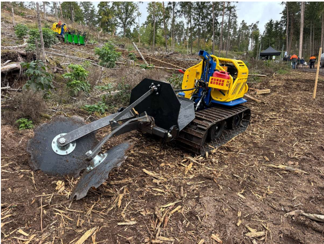
Forstraupe Kapsen mit zwei gewölbten Zahnscheiben zur Bodenverwendung – ein Prototyp von Reil & Eichinger