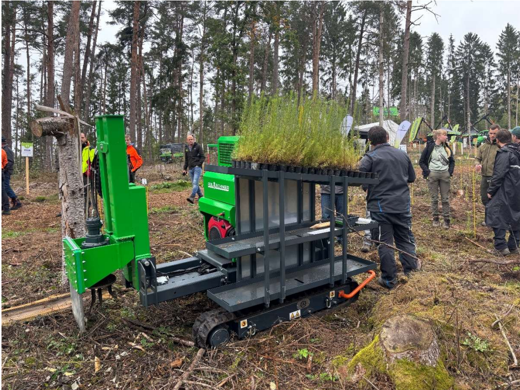
Pflanzraupe von Reil & Eichinger mit Containerpflanzen