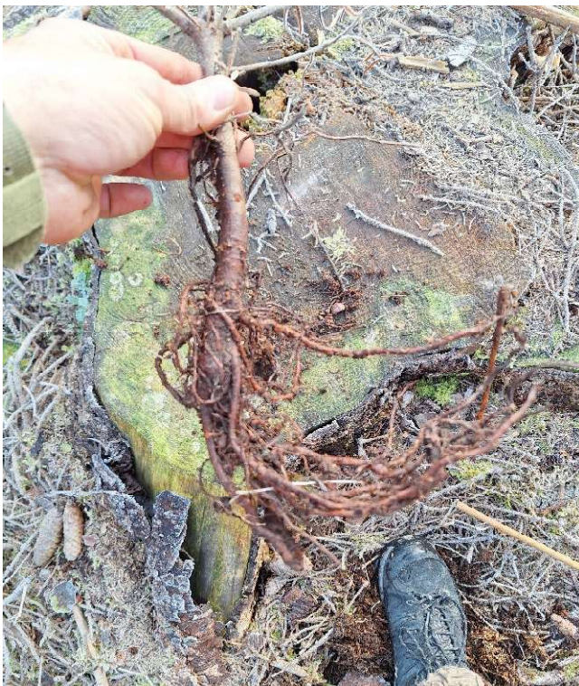
WTa mit Entenfuß führt zu stark instabilen Bäumen

Nicht förderfähig sind Ausfälle auf Grund von Wildverbiss, mangelnder Pflege (Ausmähen) oder nicht fachgerechter Pflanzung.