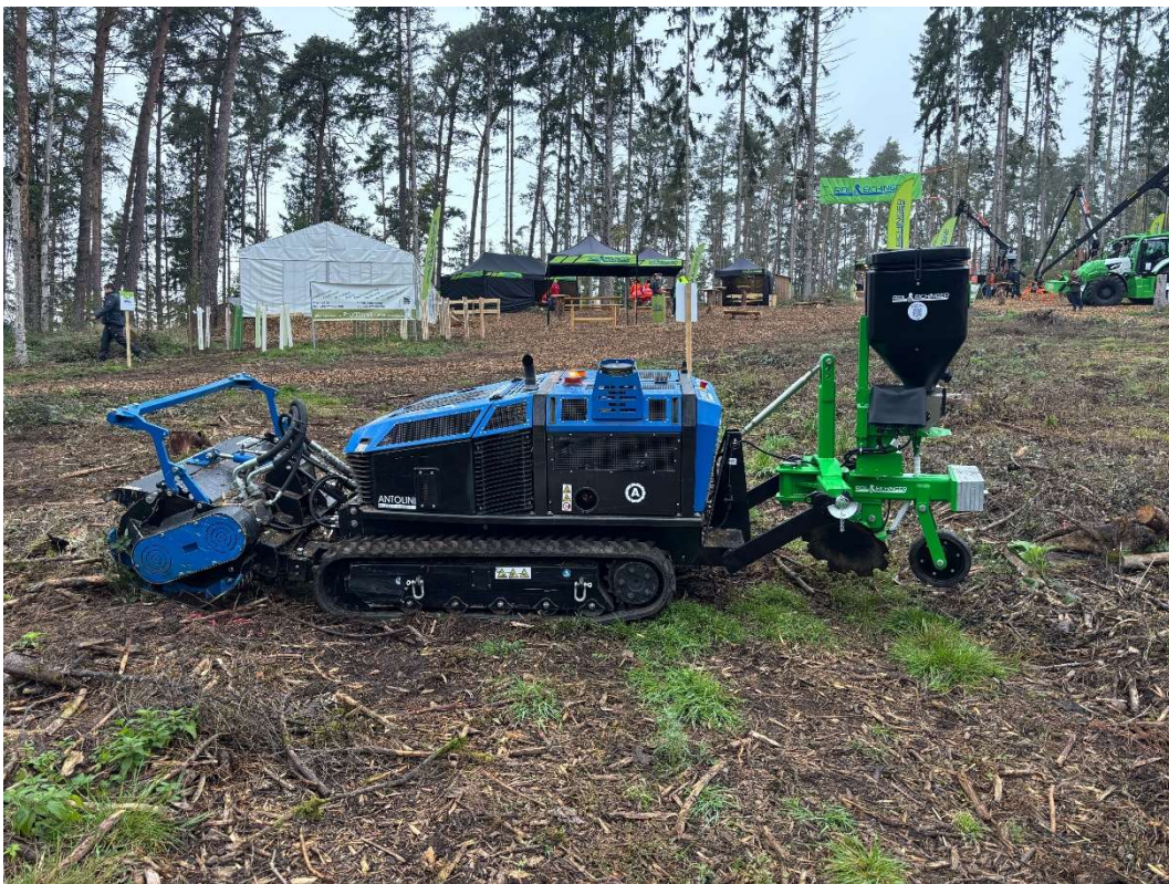
Forstraupe Antolini mit Forstmulcher und Säeinrichtung von Reil & Eichinger

Ein Schwerpunkt der Veranstaltung waren die ferngesteuerten Forstraupen. Diese kompakten Helfer sind speziell für Einsätze im Zaunbau konzipiert, können aber auch als universelle Geräteträger mit einem oder zwei Anbauräumen eingesetzt werden.